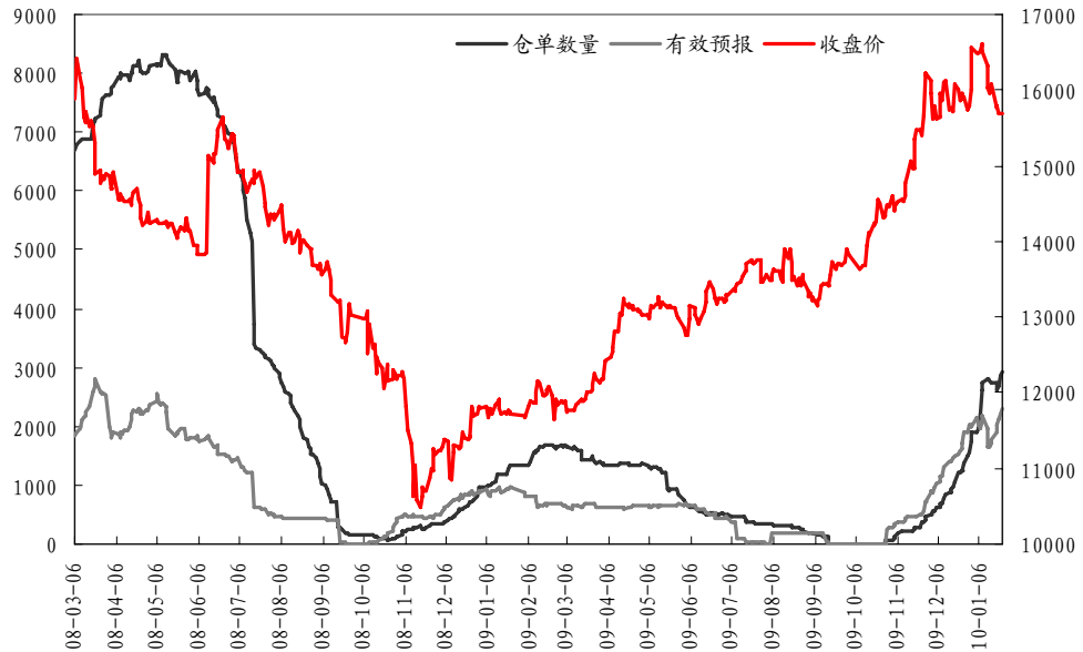
图 1： 郑州棉花期价与仓单